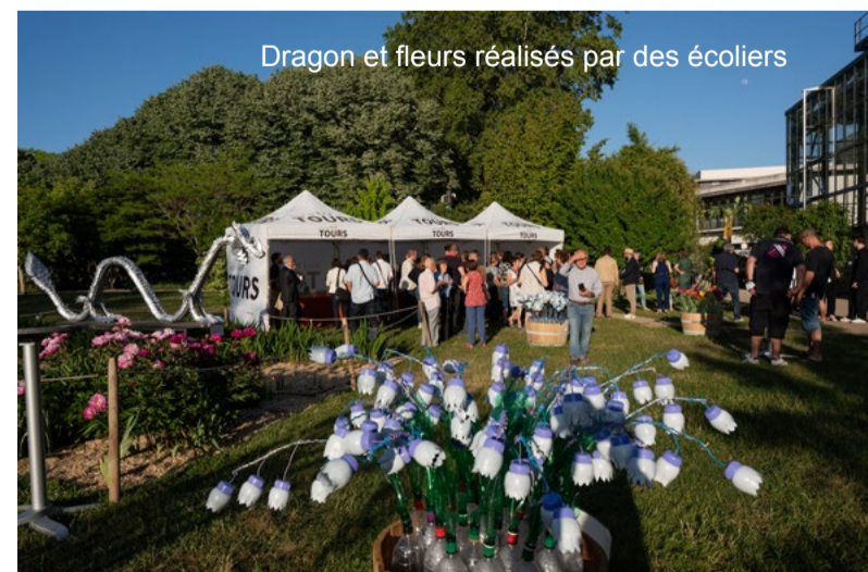
Dragon et fleurs réalisés par des écoliers

Le 13 mai 2022, dans la serre du Jardin botanique de Tours, le premier Voyage au cœur de nos poubelles est inauguré en présence des élus de la Ville, de la Métropole, du Président de la Région, du Directeur de l'Ademe Centre et de ses contributeurs.