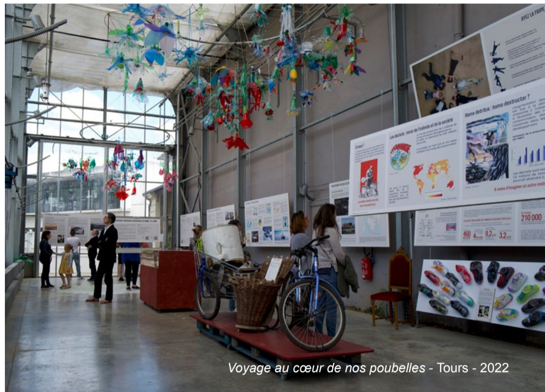
Voyage au cœur de nos poubelles - Tours - 2022

Elle invite à un voyage réflexif à la découverte de nos déchets, mais aussi des femmes et des hommes qui s'en occupent.