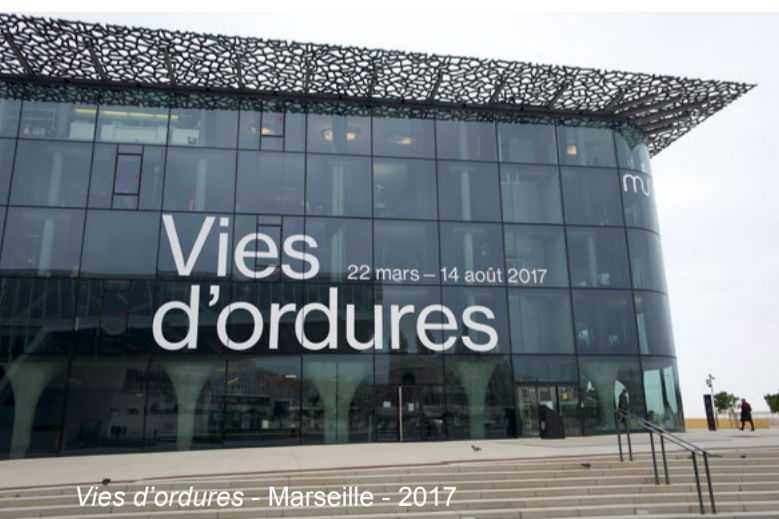
Vies d'ordures - Marseille - 2017

Regarder ce que nous faisons de nos restes c'est donc regarder notre monde