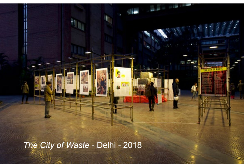
The City of Waste - Delhi - 2018

L'exposition a été visitée par 10 000 personnes dont 2000 scolaires