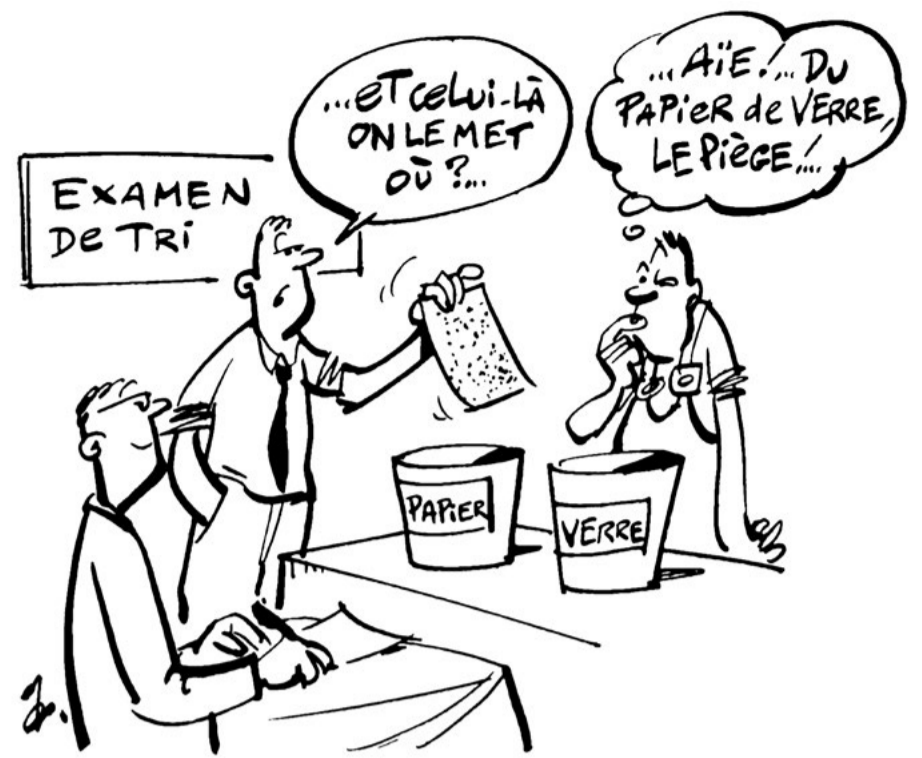
L'exposition est ponctuée de dessins humoristiques

Une exposition gratuite, accessible à tous, à visée pédagogique et à destination du grand public